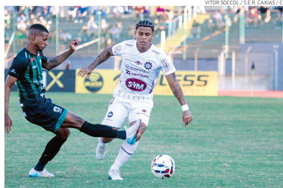
Caxias atuou com um time misto e foi derrotado pelo Maringá por 3 a 0

O Corinthians terá mais uma chance de ampliar sua hegemonia no Brasileirão Feminino. Nesse domingo, as Brabças, que haviam ganhado na ida, garantiram a vaga na final com o empate por 2 a 2 com o São Paulo, e agora irão enfrentar o Cruzeiro, que passou pelo Palmeiras no placar agregado de 4 a 3. Desde 2017 que o Corinthians é uma das equipes finalistas da competição e só não levantou a taça em 2017, contra o Santos, e em 2019, contra a Ferroviária. A CBF ainda não divulgou a data dos confrontos da grande final, mas eles devem acontecer nos dois próximos finais de semana. Em razão da pontuação do campeonato, o Corinthians terá a vantagem de decidir o jogo decisivo na Neo Química Arena.