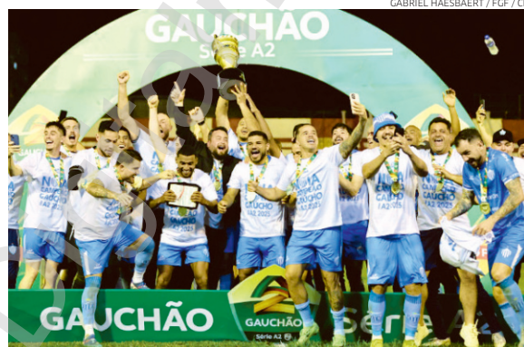
Jogadores e comissão técnica do Novo Hamburgo vibram com a taça

Do outro lado, o Inter retorna à elite estadual depois de 14 anos de espera, mas com a sensação amarga da perda da taça. E na bronca com a arbitragem na decisão. O fim do jogo teve polêmica e jogador dos visitan-